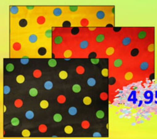
Polyester-Satin Art.Nr.: 5186