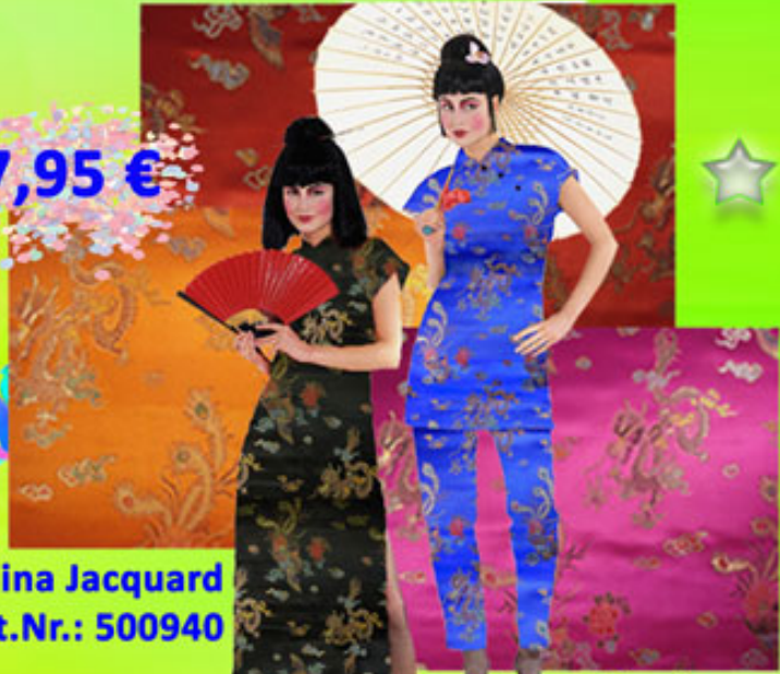
China Jacquard Art.Nr.: 500940