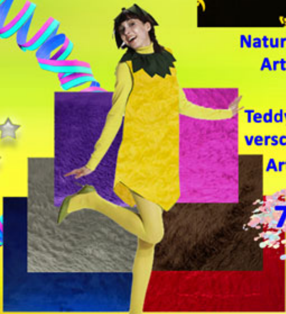
Burda-Schnittmuster Art.Nr.: B-2450