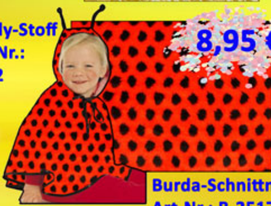
Burda-Schnittmuster Art.Nr.: B-2517